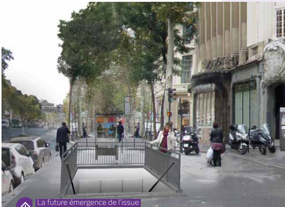
↑ La future émergence de l'issue de secours supplémentaire.

Deux escaliers mécaniques supplémentaires permettant de relier les quais à la mezzanine seront ajoutés aux escaliers mécaniques existants.