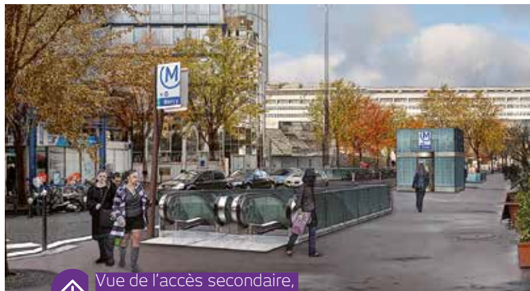
↑ Vue de l'accès secondaire, rue de Bercy