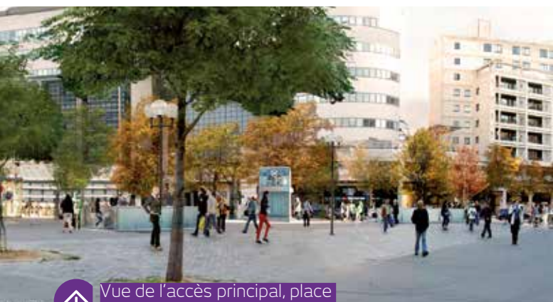
↑ Vue de l'accès principal, place du Bataillon du Pacifique

Prévus pour mettre en sécurité les usagers en fauteuil roulant en cas de sinistre et répondre aux nouvelles normes relatives aux conditions d'évacuation en sécurité des personnes à mobilité réduite (PMR), ces espaces seront implantés sur les quais (deux sur chaque quai), un au niveau de la salle des billets et deux au niveau de l'accès secondaire.